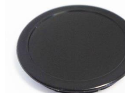
Black Base Cap