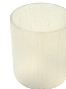
White Sleeve Cover