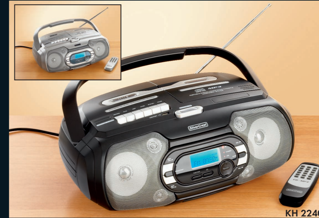
Ⓝ CD-SPILLER Bruksanvisning