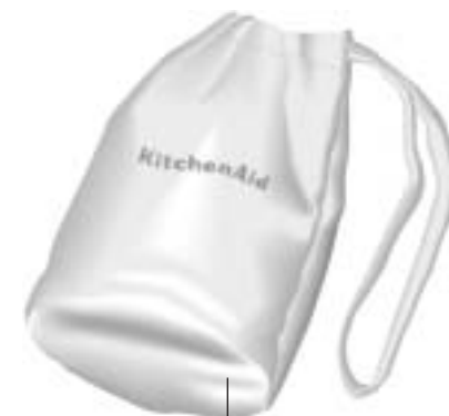
Sac de rangement (modèle 4KHB300 seulement)

Le sac de rangement (modèle 4KHB300 seulement) en coton croisé fermé par un cordon présente trois pochettes pour ranger le corps du moteur du mélangeur à immersion, le pied-mélangeur en acier inoxydable et le fouet. Ce sac de rangement est lavable à la machine.