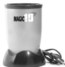
Een krachtig motorblok