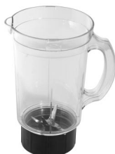
Magic 10 Blender en deksels