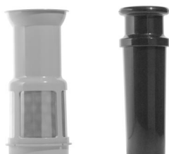
Centrifuge Aandrukstuk Vruchtenpers Centrifugekit