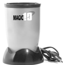
High-Torque Power Base