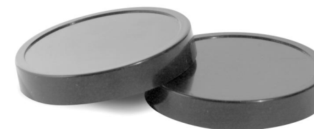
Stay fresh re-sealable lids

You can even bring your leftovers to work or school, by just tossing the sealed cup into your bag and go! The at work, you can reheat your leftovers in the microwave – all in the same cup!