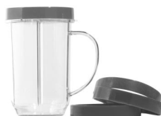
Tasses de fête