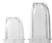
Tasse basse, Grande tasse