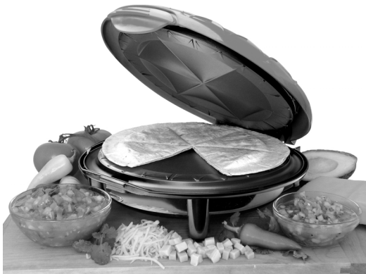
The ELECTRIC QUESADILLA MAKER™

Place the other tortilla on top and close the lid. Cook as directed for 3 to 5 minutes. Open lid with pot holder or oven mitt, serve with salsa or picante sauce.