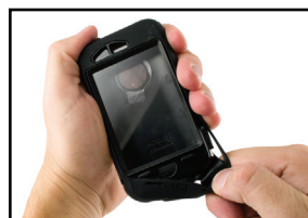
Step 6/ Étape 6/ Paso 6

Envuelva la película de silicona alrededor de la unidad. Confirme que se ubiquen las ranuras de retención para la silicona como se muestra. Nota: Si alguna parte queda desalineada desarme la funda y comience de nuevo. Preste especial atención a la alineación del teclado, la pantalla y las características de la funda en cada paso de la instalación.