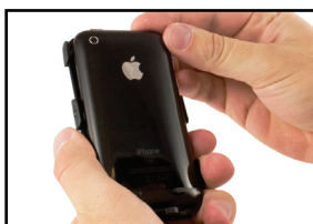
Step 4/ Étape 4/ Paso 4