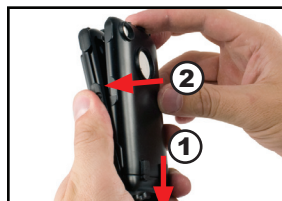
Step 5/ Étape 5/ Paso 5

Cierre uniendo la tapa plástica con la base.