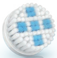
DEEP PORE Cleansing brush head (SC5996)

2 Special needs and care / Soins et besoins spécifiques / Necessità e cure speciali / Speciale behoeften en verzorging / Особый уход и забота