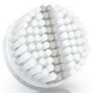
EXFOLIATION brush head (SC5992)

3 Weekly exfoliation / Exfoliation hebdomadaire / Esfoliazione settimanale / Wekelijkse scrub / Ежедневный пилинг