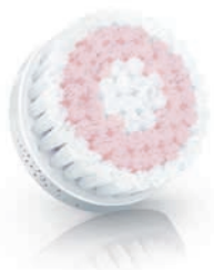
SENSITIVE brush head (SC5991)