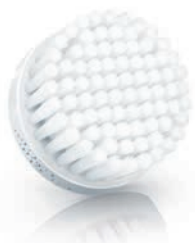
NORMAL brush head (SC5990)