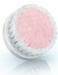
EXTRA SENSITIVE brush head (SC5993)

2 Special needs and care / Soins et besoins spécifiques / Necessità e cure speciali / Speciale behoeften en verzorging / Особый уход и забота