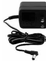
120 VOLT AC CHARGING ADAPTER

Cerciórese de que el resto de las funciones de la unidad estén dadas vuelta APAGADO durante recargar, pues ésta puede retardar el proceso que recarga.