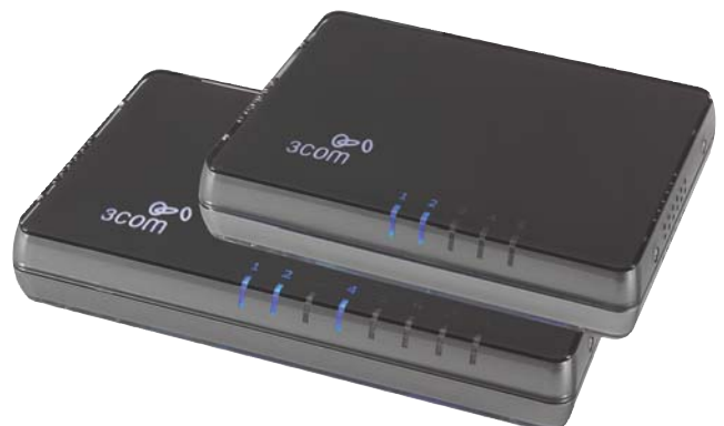
위에서부터: 3Com Switch 5, 3Com Switch 8

운영 체제 독립성 네트워크의 추가적인 구성 없이 네트워크 내에서 서로 다른 운영 체제의 통합을 지원합니다.