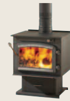
CLASSIC EPA DB05345