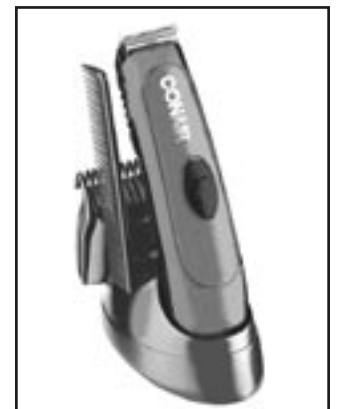
Modelo GMT100RQCS Folleto de instrucciones

Conair le agradece por elegir nuestro recortador de barba y bigote. Sabemos que le proporcionará años de servicio confiable.