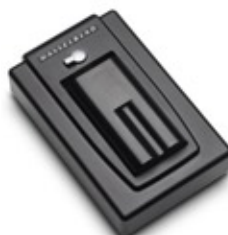
Memorizzazione ultrarapida con Image Bank da 100 GB.