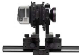
Dorso H3D-39 con i-Adapter utilizzato su un banco ottico.