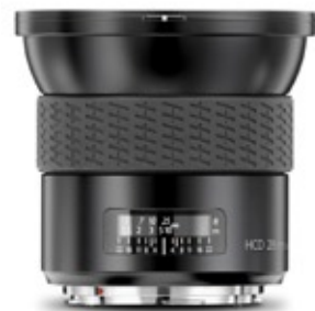
Obiettivo HCD con Full-Frame da 28mm: una qualità di immagine straordinaria esente da distorsioni.

L'innovativa tecnologia della H3D ha consentito di ideare un obiettivo da 28mm sviluppato appositamente ed espressamente per questa fotocamera. Il design è stato ottimizzato per l'area del sensore da 36x48mm della H3D e il risultato è un obiettivo estremamente compatto che può utilizzare appieno la funzione Digital APO Correction ed aumentare ulteriormente la risoluzione dell'immagine.